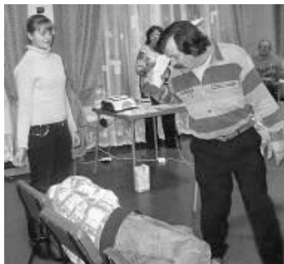
На фото: Сёстры из Молдовы и Украины составляют список.

Одно из вечерних занятий было посвящено 16-ой главе “Послания к Римлянам”. Каждый участник получил задание написать список имён тех братьев и сестер, которым они благодарны. А в результате было так удивительно сознавать, насколько выросла наша общая христианская семья, благодаря участию каждого из нас в проповеди Евангелия в течении всего лишь 15 лет.