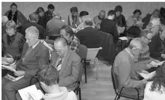
На фото: Обсуждение “Послания Иакова”